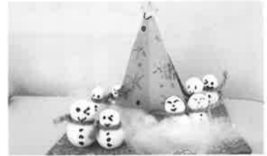
雪だるまともみの木