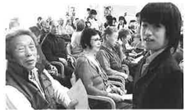
壮瞥小学校出前学芸会で、楽器演奏や演劇を終えて、子どもたちと利用者の皆さんとの交流場面です。 「みんな上手でした。ありがとうネ。」