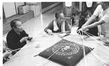
「宝引き」どの紐が当たりかな?