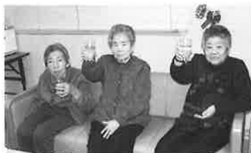
ルネッサ〜ン…古いか!?