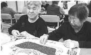
貼り絵・塗り絵作業に一所懸命です。