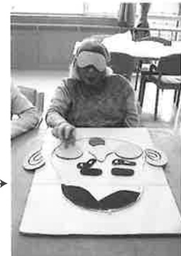
真剣に取り組んでいます。上手くできたかな?