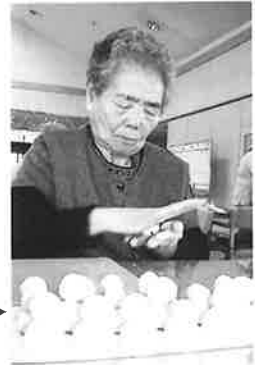
作品づくり作業風景