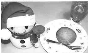
美味しそうなお菓子があるなあ