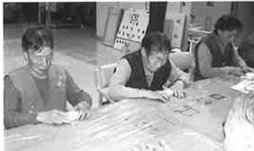
形づくりが意外に難しいよ。