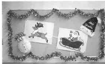
サンタとトナカイの貼り絵