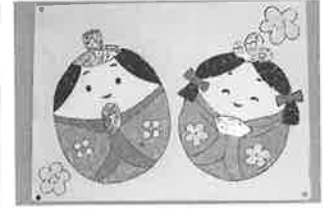
ひなまつりちぎり絵