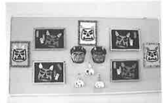
節分にて「鬼シリーズ」