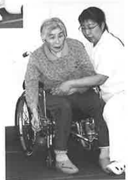
砂の入ったボールで 的の高得点を狙うゲー ムに参加しています。 何点取れたかな？