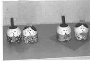
コロコロおひなさま