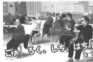
ごは、ろく、しち、はち...