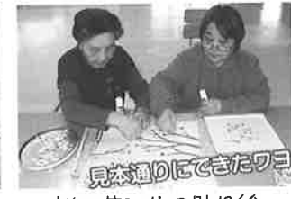
桜の花びらの貼り絵