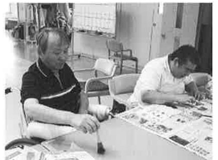
テーブル掃除、ご苦労様です