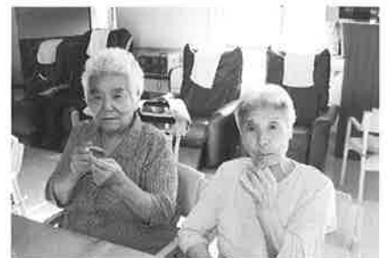
枝豆を食べながらハイチーズ!! (仲よし二人組です)