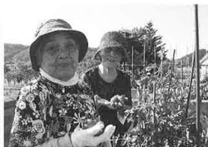
こんなに沢山採れたよ