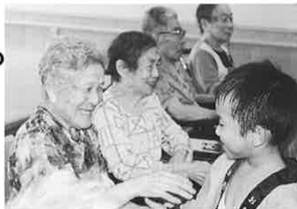
めんこいね。またおいでよ