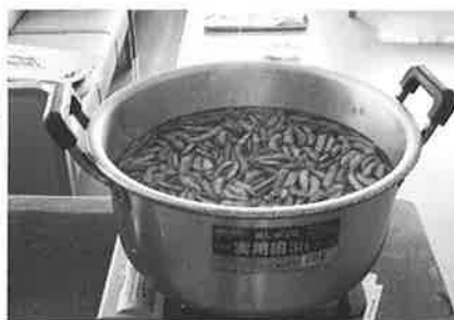
塩茹でにしています