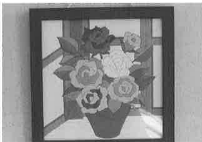
パウダーアート作品 (五色のバラ)