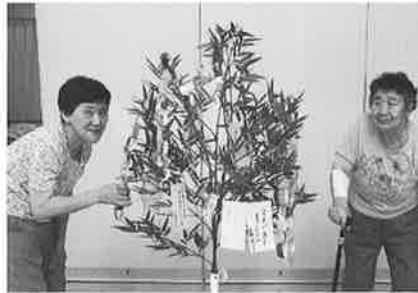
七夕飾りです。 何をお願いしたのかな？