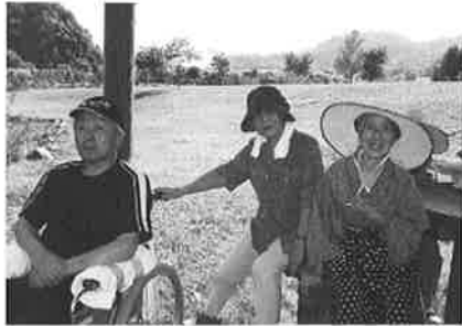
ドライブバスハイクで 洞爺湖町財田公園での一コマ