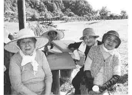
外は風もあり、気持ちがいいね〜