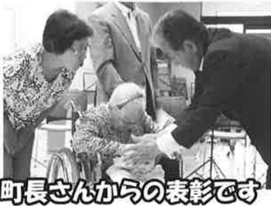
町長さんからの表彰です