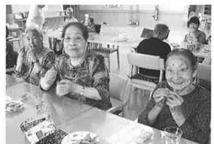
採れたては新鮮で美味しいね