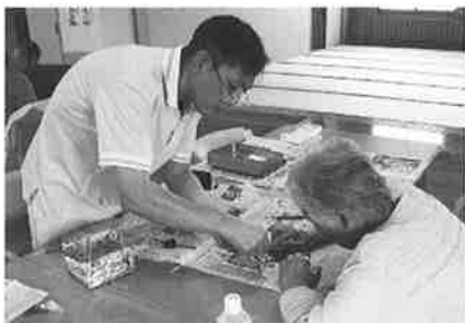
職員と一緒にパウダーアート 作品に挑戦中です