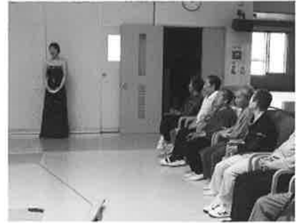
ボランティア(音大生)の 素晴らしい歌声に聴き入ってます