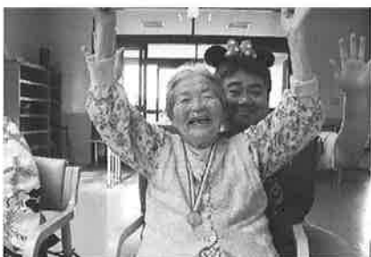
ふれあい広場農園で採れたトマトを 食べて、金メダル獲得しました!!