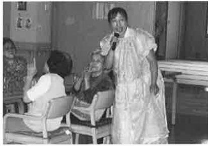
職員も負けじと仮装して 『人生いろいろ〜』