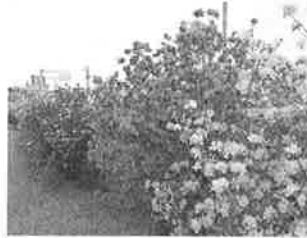
見事な紫ツツジです。