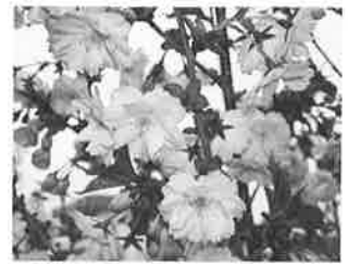
やっぱり日本人は サクラでしょ!!