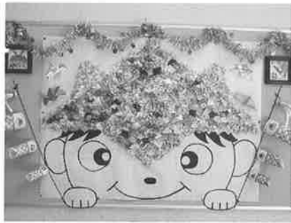
5月の作品 (折り紙で兜)