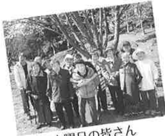
木曜日の皆さん (善光寺にて)