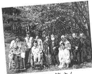
金曜日の皆さん (善光寺にて)