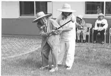
裏庭のパークゴルフ大会? でのナイスショット!!