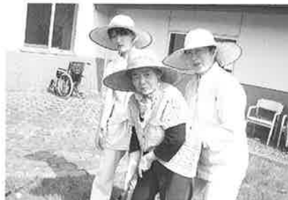
私達にだって出来るワヨ