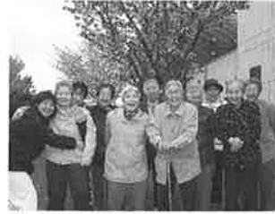
水曜日の皆さん (加チャーターにて)