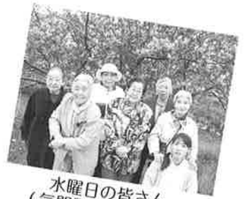
木曜日の皆さん (気門別河川敷にて)