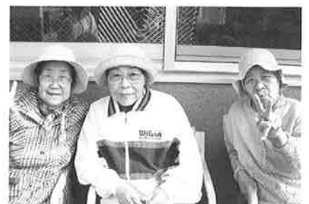
パークゴルフ応援団で ハイ、ピース!!