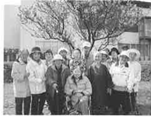
火曜日の皆さん (図書館駐車場にて)