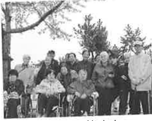
月曜日の皆さん (加チャーター駐車場にて)