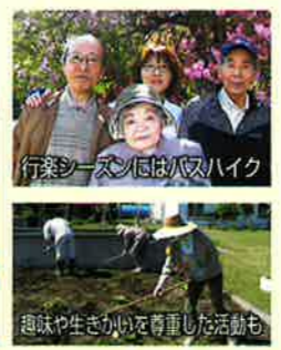
趣味や生きがいを尊重した活動も