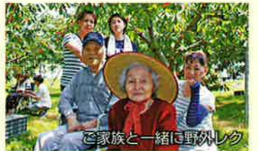
ご家族と一緒に野外レク

対象者 原則要介護3以上 定員50名 ※要介護1~2の方でも、特定の要件を満たせば入所可能。