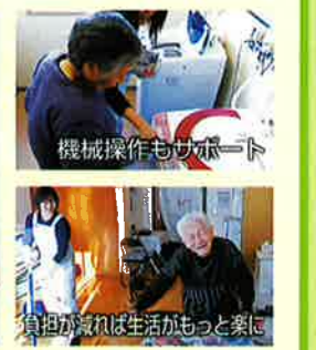
機械操作もサポート 負担が減れば生活がもっと楽に