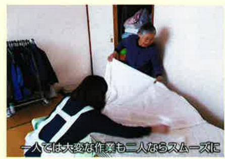
一人では大変な作業も二人ならスムーズに