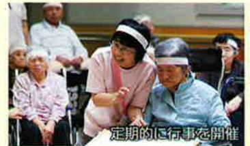
定期的に行事を開催

身体が不自由で日常生活に常時介護を必要とする方が入所して生活する施設です。万全の体制でスタッフがサポートいたします。